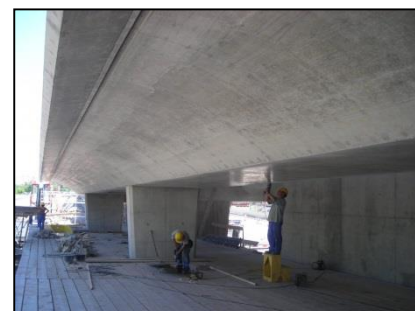
Ponts latéraux de Pré-Bois, Blandonnet